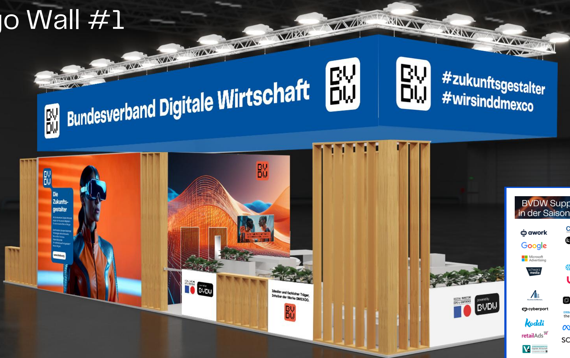
Beispielhafte Darstellung bei einem Großevent