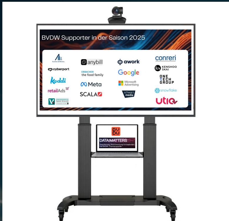
Beispielhafte Darstellung einer digitalen Logo Wall (auf einem Event)