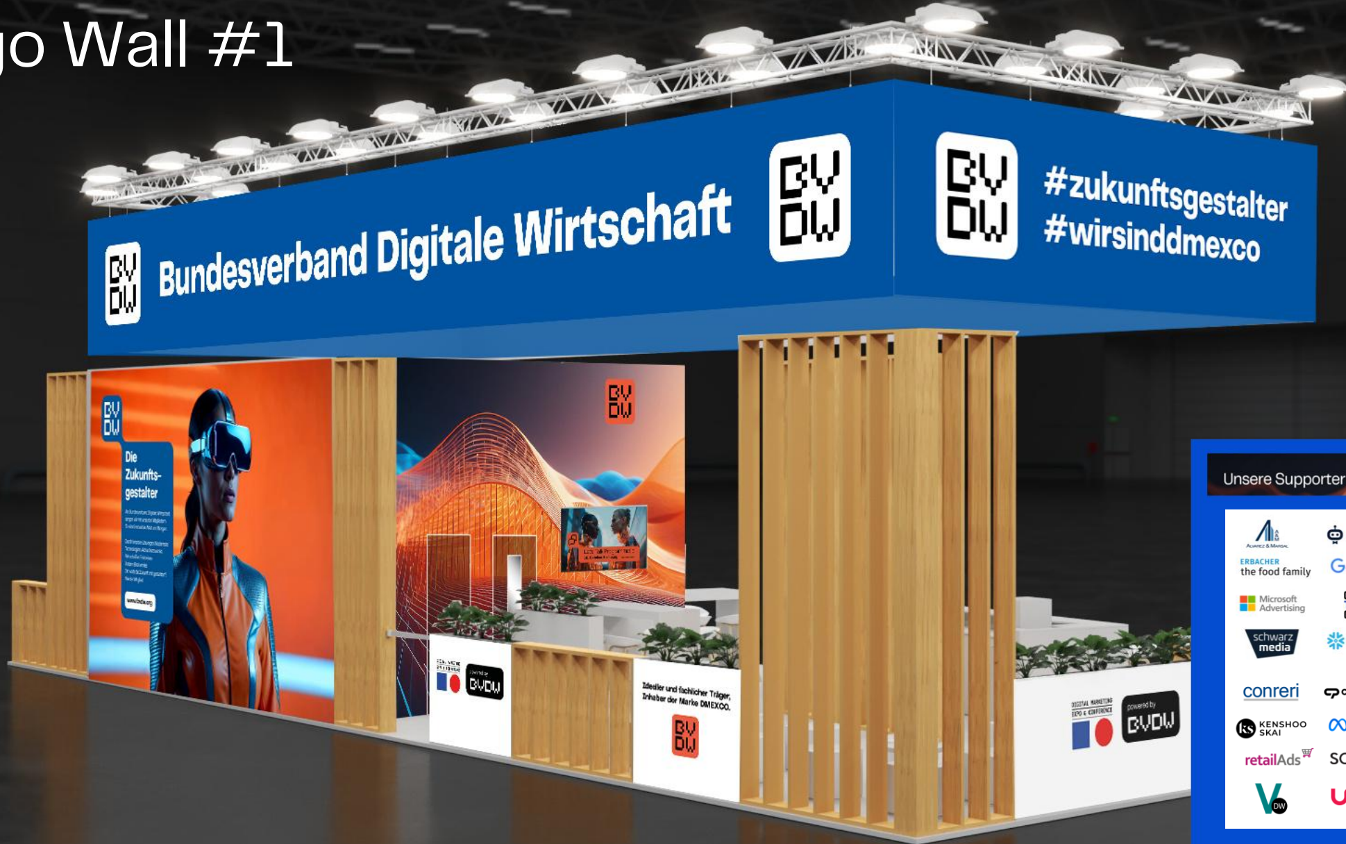
Beispielhafte Darstellung bei einem Großevent