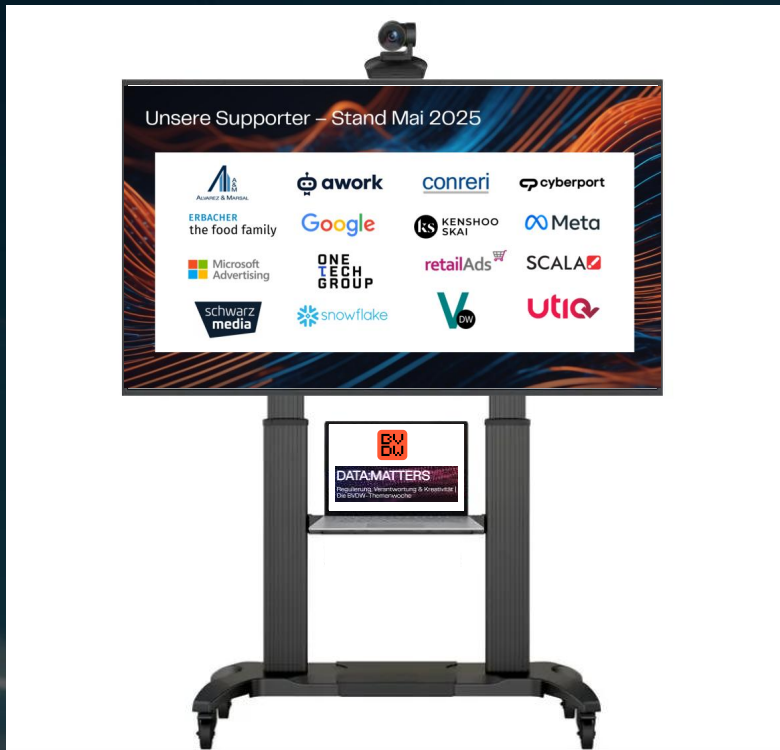
Beispielhafte Darstellung einer digitalen Logo Wall (auf einem Event)